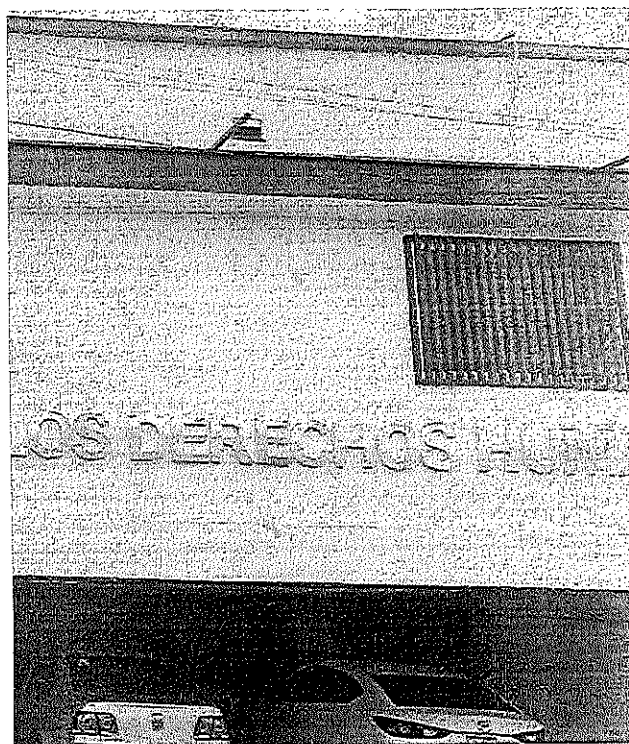
DIRECCIÓN DE CONTROL, ANÁLISIS Y EVALUACIÓN 1 PIEZA. MEDIDAS: 1.70 X 1.20 MTS.